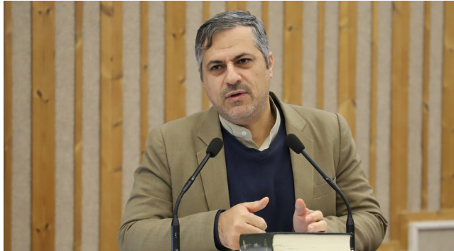
رئیس دانشگاه در همایش ملی روستا و روستانشینان در بستر تحولات تاریخی؛